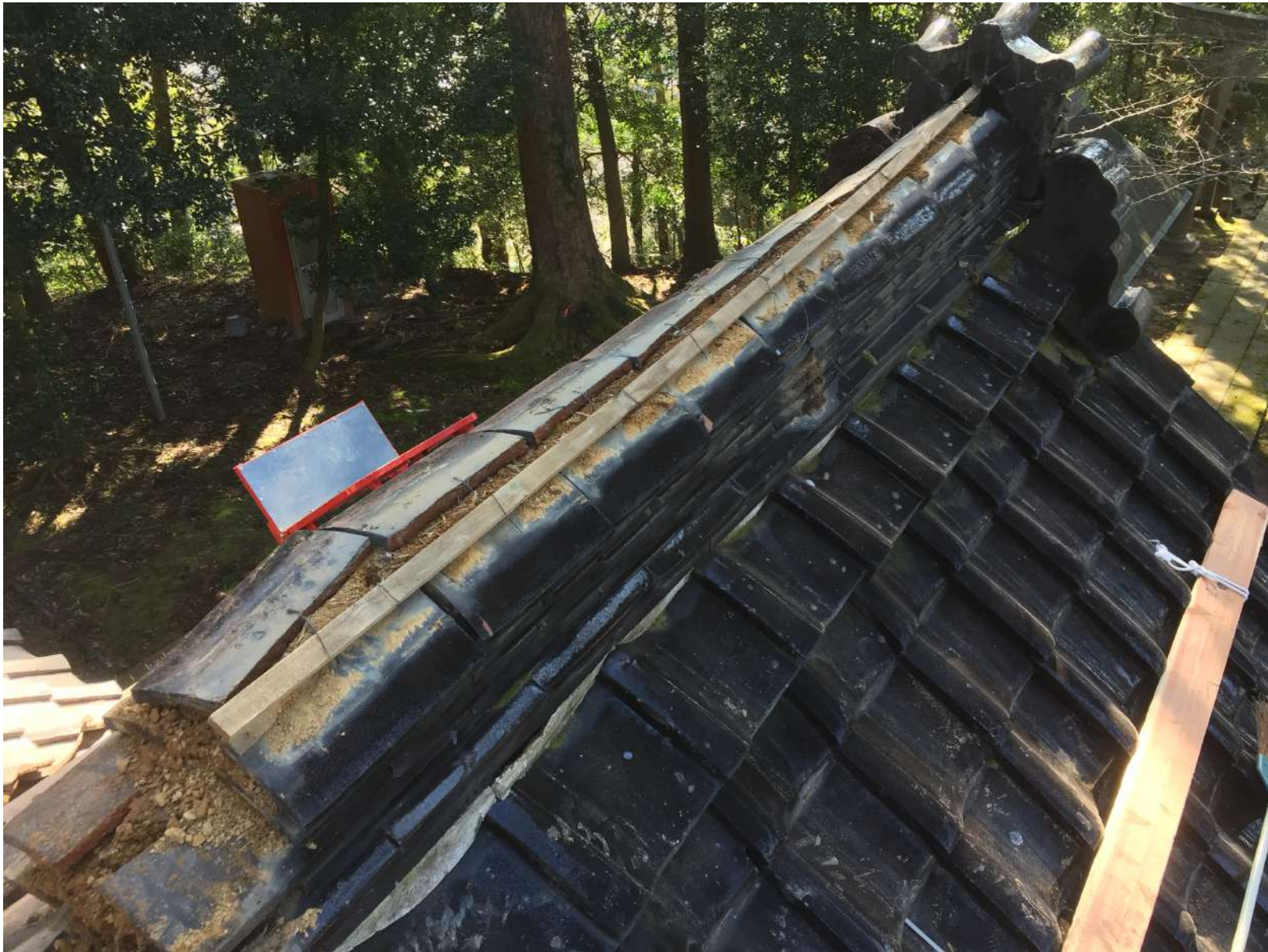
拝殿拝み屋根棟ばらし